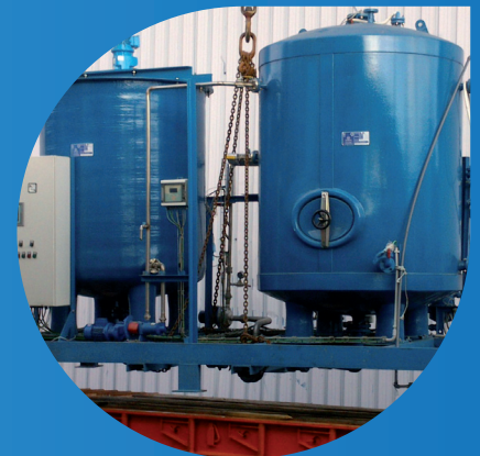
Planta Piloto Biowamet

Se tratará y valorizará el agua residual urbana en Bitem (Tortosa/Tarragona) tras la reconversión de unas fosas sépticas y las aguas negras recogidas en el edificio principal de un parque industrial en Nigrán (Pontevedra), parque dotado de un sistema descentralizado de recogida de aguas residuales. En ambos casos, el agua tratada será utilizada para regadío.